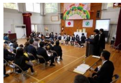
小・中・早期発達支援室 入学式・入所式