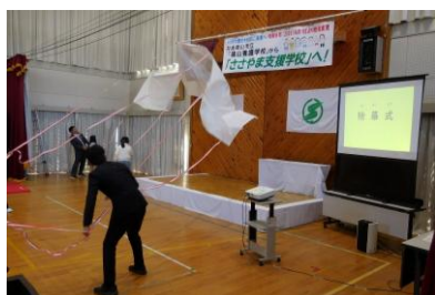
校名変更記念式典