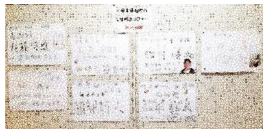
立候補者の選挙ポスター掲示板

の2つです。まずは、立会演説会で自らの公約をしっかりと伝え、周囲から承認を得ることです。先輩からのバトンを受け継ぎ、素晴らしい児童生徒会を築いてください。楽しみにしています。