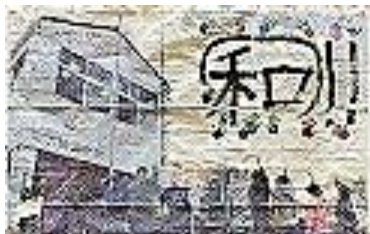
高等部 劇「SASAYOU QUEST XIII」より

後になりましたが、保護者・地域の皆様には、開催方法等についてご理解いただきましたことに深く感謝いたします。一刻も早く、新型コロナウイルスによる感染拡大が終息し、皆様とともに教育活動が実施できることを心待ちにしています。